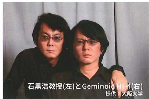
石黒浩教授(左)とGeminoid HI-4(右) 提供 大阪大学

講師 石黒浩氏 大阪大学基礎工学研究科教授 (荣誉教授) ATR石黒浩特別研究所客員所長